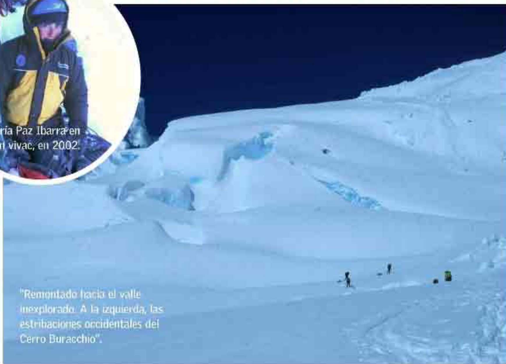
"Remontado hacia el valle inexplorado. A la izquierda, las estribaciones occidentales del Cerro Buracchio".