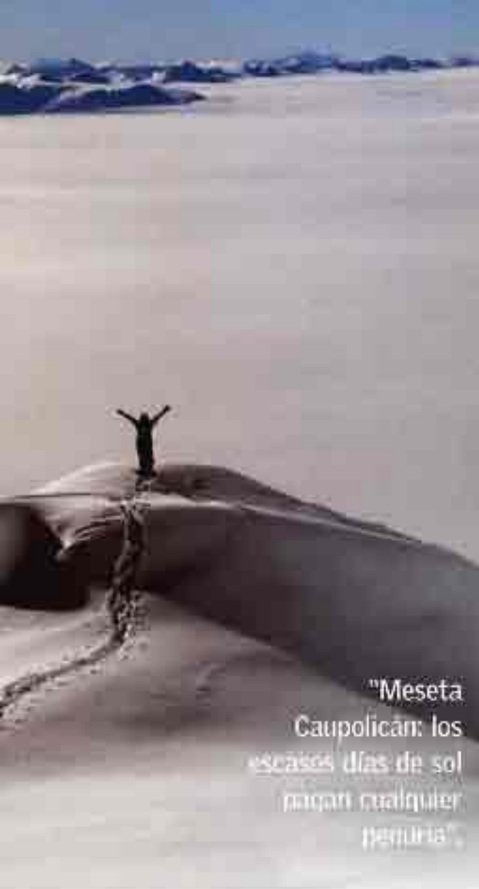
"Meseta Caupolicán: los escasos días de sol paqari cualquier penuria".